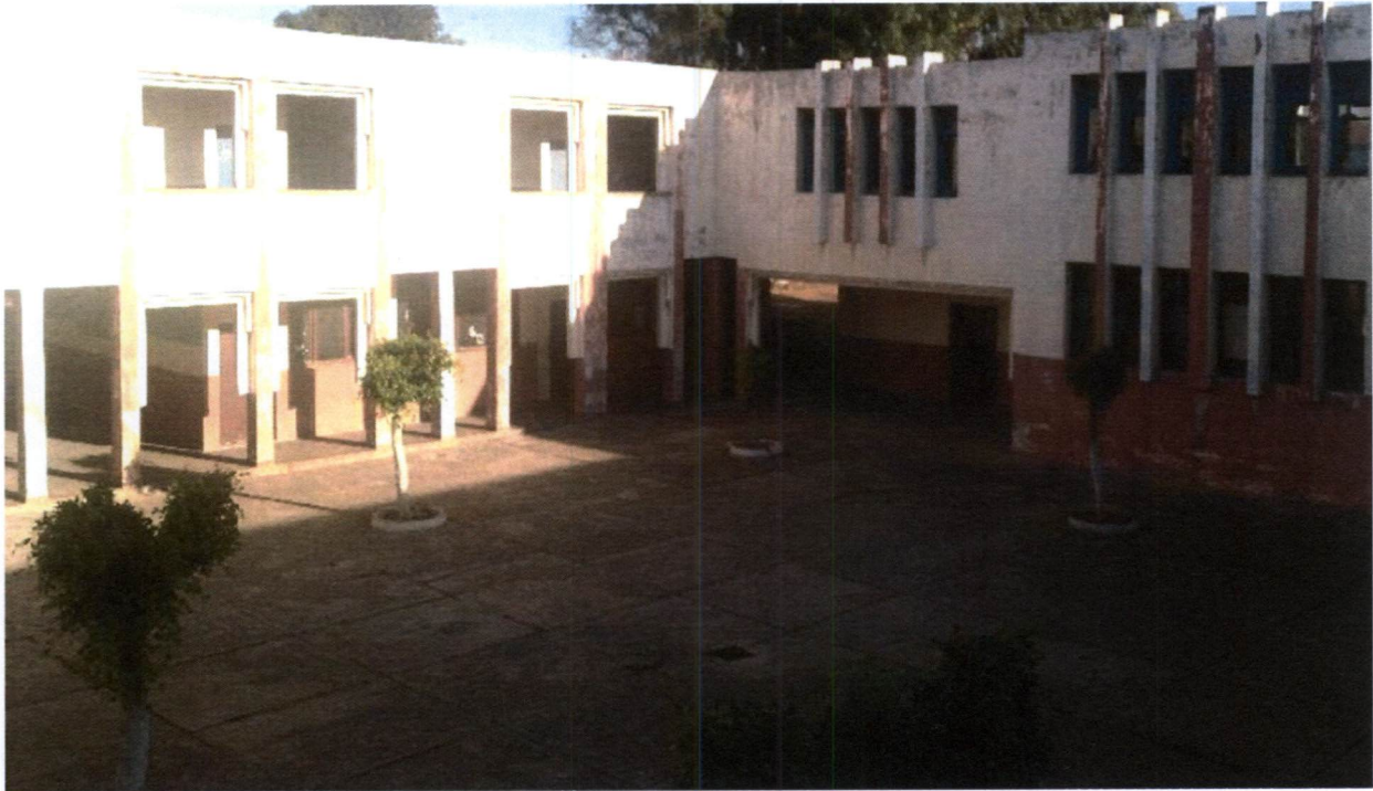
Cour et bâtiments existants